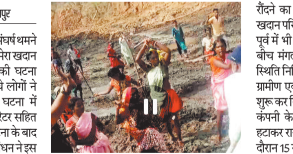
परसोड़ीकला व कटकोना में भूमि का अधिग्रहण किया जाना है। भूमि अधिग्रहण और खदान के विस्तार को लेकर ग्रामीणों द्वारा लम्बे समय से विरोध किया जा रहा है। पिछले एक साल से लगातार ग्रामीण अपना विरोध दर्ज करा रहे हैं। इस दौरान ग्रामीणों ने बिना मुआवजा वितरण किए ही किसानों की जमीन पर कब्जा कर उनकी धान की फसलों को

अमेरा खुली खदान के विस्तार को लेकर संघर्ष थमने का नाम नहीं ले रहा है। एक बार फिर से अमेरा खदान में काम कर रहे कर्मचारियों पर हमले की घटना सामने आई है। दर्जनों की संख्या में पहुंचे लोगों ने कर्मचारियों पर हमला कर दिया। इस घटना में माईनिंग कंपनी के मैनेजर, पोस्कलेन ऑपरेंटर सहित अन्य लोगों को गंभीर चोटें आई हैं। इस घटना के बाद क्षेत्र में हड़कंप मच गया है। एएसईसीएल प्रबंधन ने इस घटना की शिकायत पुलिस से की है जिसके बाद पुलिस ने मामलों की जांच शुरू कर दी है। प्रबंधन का आरोप है कि मारपीट करने वाले भाड़े पर बुलाए गए बहरी लोग थे।