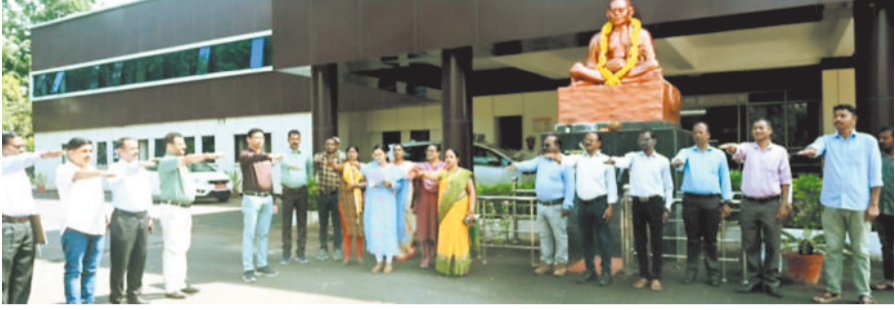
चरचा में स्वच्छता ही सेवा अभियान का समापन