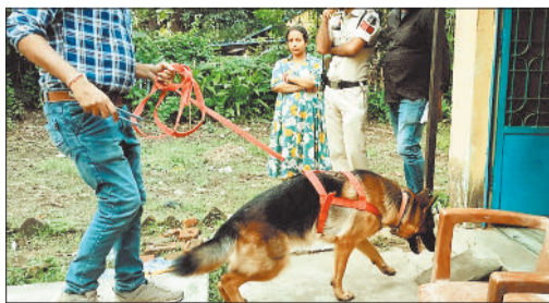
सुराग के लिए डॉग स्वयाय की ली गई मदद।

जानकारी के अनुसार घटना के दौरान कॉलोनी स्थित मकान सून थे। चोरों ने मौके का फायदा उठाते हुए घरों के ताले तोड़े और कौमोती सामान लेकर फरार हो गए। चोरों की इस बड़ी वारदात से क्षेत्र में दहशत और आक्रोश दोनों ही देखने को