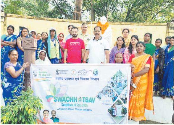
मिलकर श्रमदान करते हुए स्वच्छता की मिसाल पेश की। दो सप्ताह तक चले इस अभियान के

चरचा कॉलरी। छग शासन के निर्देशानुसार नगर पालिका परिषद शिवपुर चरचा में 17 सितंबर से 2 अक्टूबर तक स्वच्छता ही सेवा अभियान उन्हाह और जनभागीदारी के साथ चलाया गया। अभियान का उद्देश्य केवल सफाई करना नहीं, बल्कि प्रत्येक नागरिक को स्वच्छता आंदोलन में सक्रिय भागीदार बनाकर स्वच्छ चरचा स्वस्थ चरचा का संदेश देना था। अभियान की शुरुआत 17 सितंबर की सुबह वार्ड क्रमांक 1 स्थित पावन छठचाट पर सामूहिक श्रमदान के साथ की गई। इस दौरान नगर पालिका अधिकारियों, जनप्रतिनिधियों और नागरिकों ने