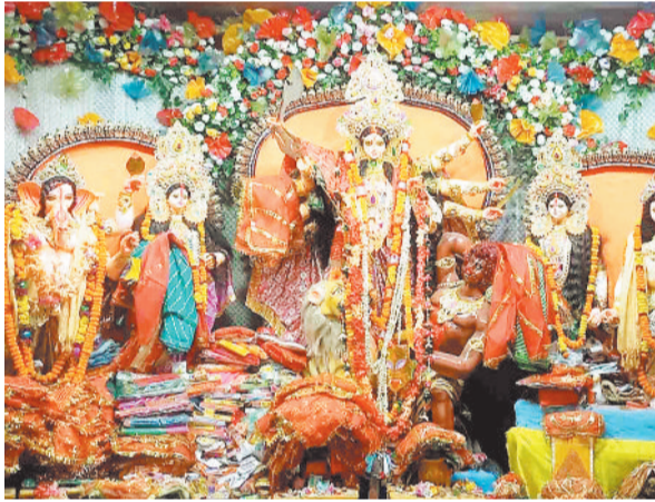
शारदीय नवरात्र के अवसर पर सरगुजा संभाग सहित जिले का माहौल भक्तिमय हो गया है। शहर माता के जसगीतों से गुंजायमान

देवी की उपासना का महापर्व शारदीय नवरात्रि के अंतिम दिन महानवमी के अवसर पर देवी मंदिरों में भक्तों की भीड़ उमड़ पड़ी। शहर के महामाया मंदिर में भक्तों ने विधि विधान से पूजा अर्चना करने के साथ ही माता के दर्शन किए। वहीं दुर्गा पंडालों में विशेष पूजा अर्चना की गई। जगह जगह कन्या भोज आयोजित किए गए जिसमें कन्याओं की पूजा करने के बाद उन्हें भोज कराया गया। भक्तों के मंदिरों में माता के दर्शन का सिलसिला देर शाम तक जारी रहा।