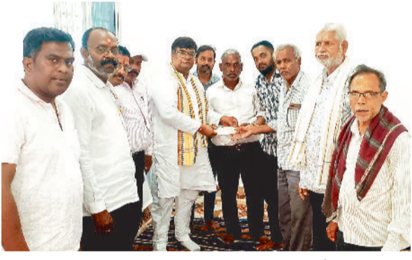
भावुक होते हुए बोले आज का दिन मेरे लिए भाव-विभोर कर देने वाला है। यह राशि केवल धन नहीं, बल्कि उन श्रमिक परिवारों का विश्वास, प्यार और आशीर्वाद है, जिनके लिए मैंने संघर्ष किया। यह जीत उनकी मेहनत और एकजुटता का परिणाम है। यह मेरे लिए अमूल्य पूंजी है, जो मुझे